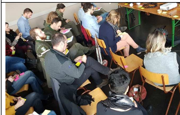
Expressions de chacun par post-it