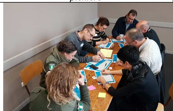
Deuxième temps, en sous-groupes