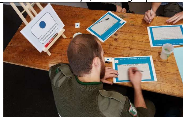
... et restitution écrite