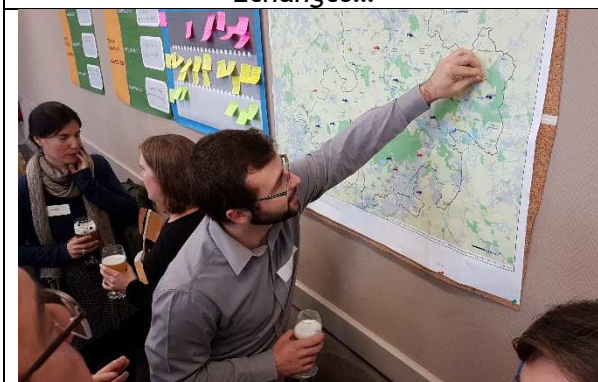
Cartographie en transfrontalier