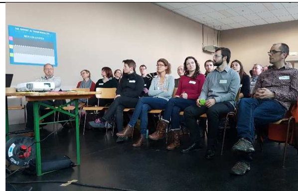
Lancement de la rencontre en format plénière