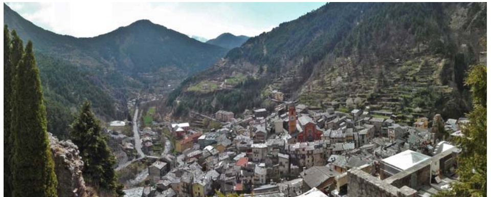
A l'extrémité occidentale de l'arc Alpin, le massif de l'Argentera-Mercantour constitue un ensemble de près de 100 000 hectares de nature préservée.

Le massif de l'Argentera-Mercantour est protégé sur son versant français par le Parc national du Mercantour et, sur son versant italien, par le Parco naturale Alpi Marittime. La collaboration très poussée de ces deux espaces naturels, jumelés depuis 1987, leur a conféré une place privilégiée pour accéder, en 2013, au statut de premier Parc européen, sous la forme d'un Groupement européen de coopération territoriale.